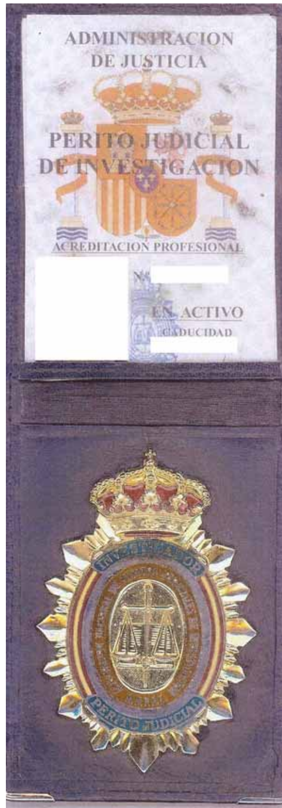
Documentación acreditativa y placa utilizada como credenciales profesionales de los Intrusos de la Asociación Española de Peritos Judiciales de Investigación.