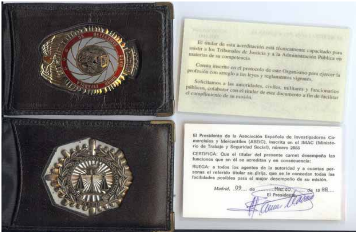
Documentación acreditativa y placa utilizada como credenciales profesionales de los Intrusos de la Asociación Española de Investigadores Comerciales y Mercantiles y de la Unión Española de Detectives.